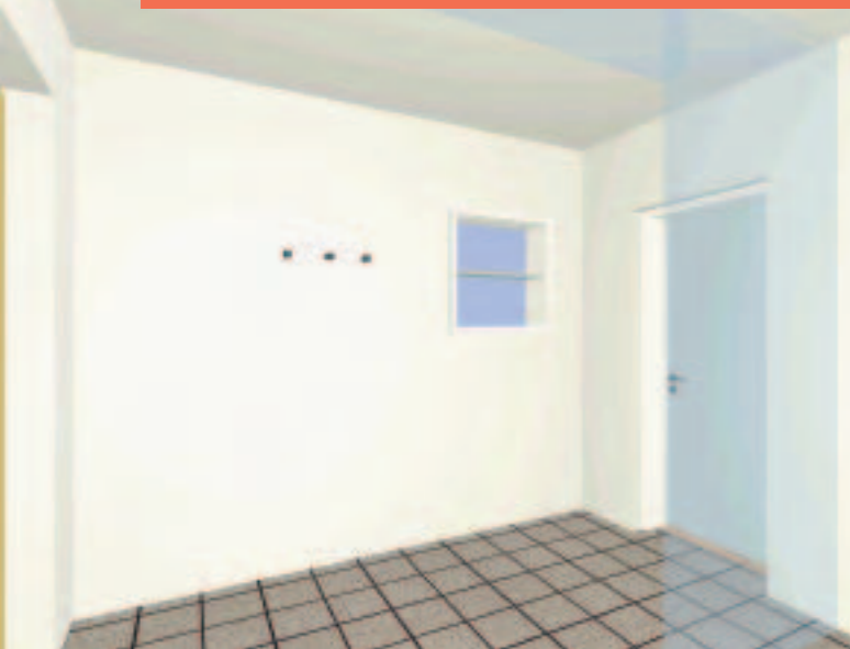
Kühler Empfang Drei Haken für die Garderobe der Gäste. Kein Platz zum Sitzen, kein Schuhschrank, keine Ablagefläche