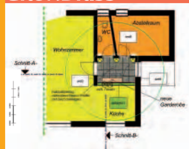
Die Raumsituation In dem kleinen quadratischen Raum gilt es das weiß gerahmte Fenster zur Küche und eine Holztüre zu berücksichtigen. Der dunkelgraue Fliesenboden soll bleiben.